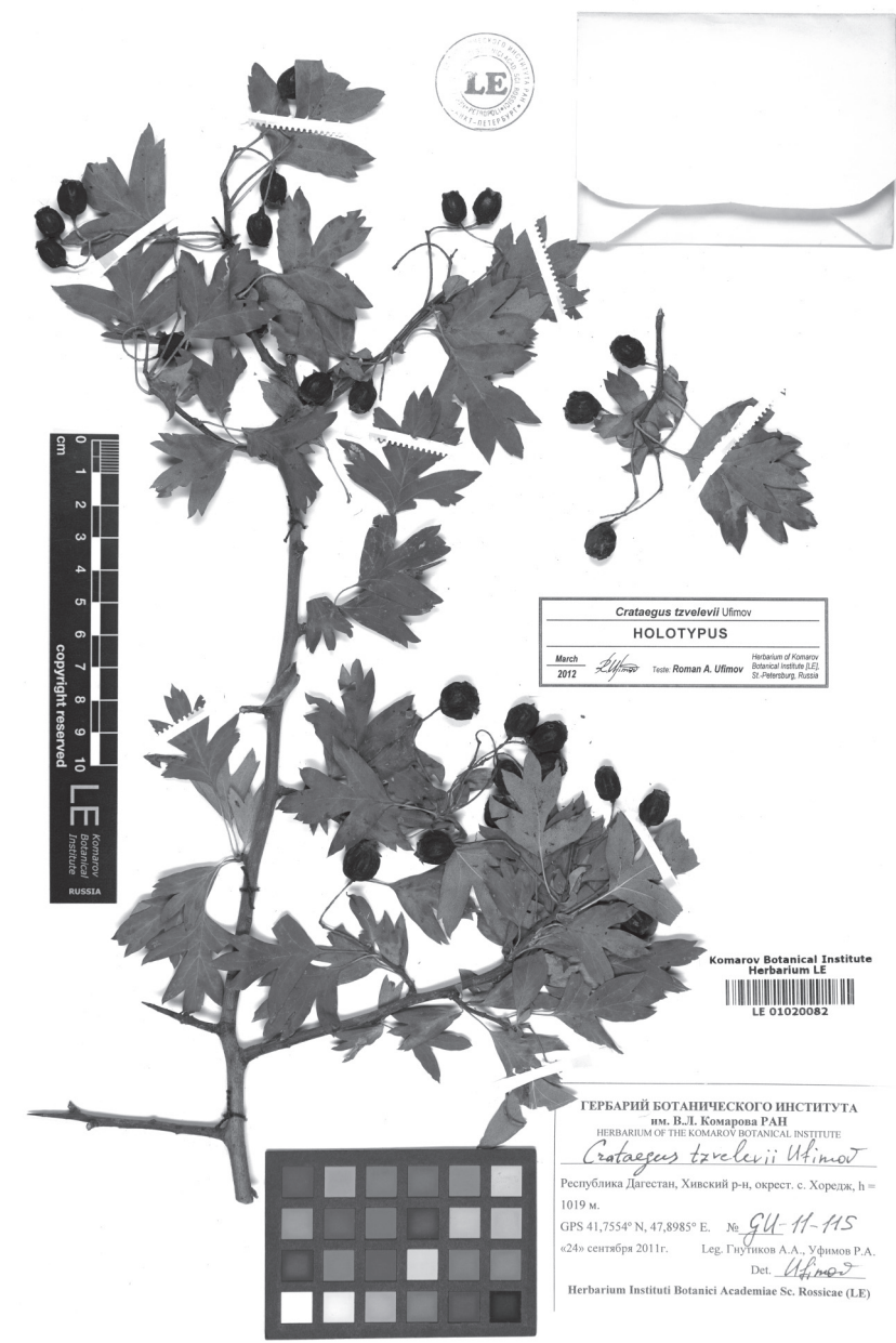
Рис. 4. Голотип Crataegus tzvelevii Ufimov.