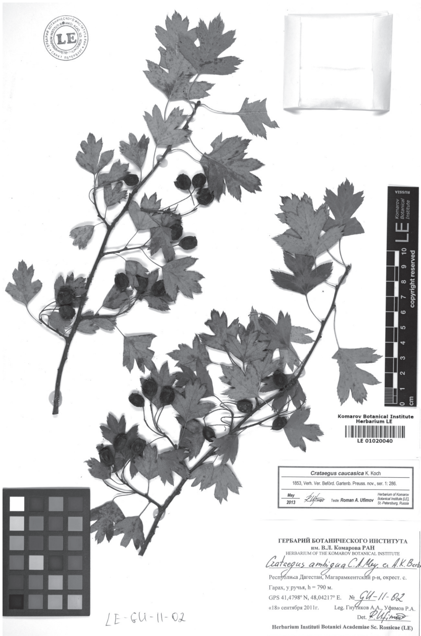
Рис. 3. Crataegus caucasica K. Koch.