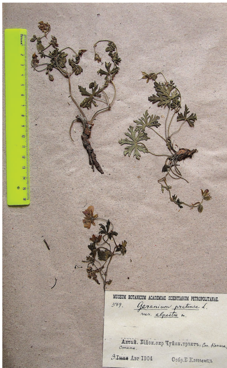
Таблица II. Лектотип Geranium pratense L. var. alpestre Krylov ex Serg. (TK).