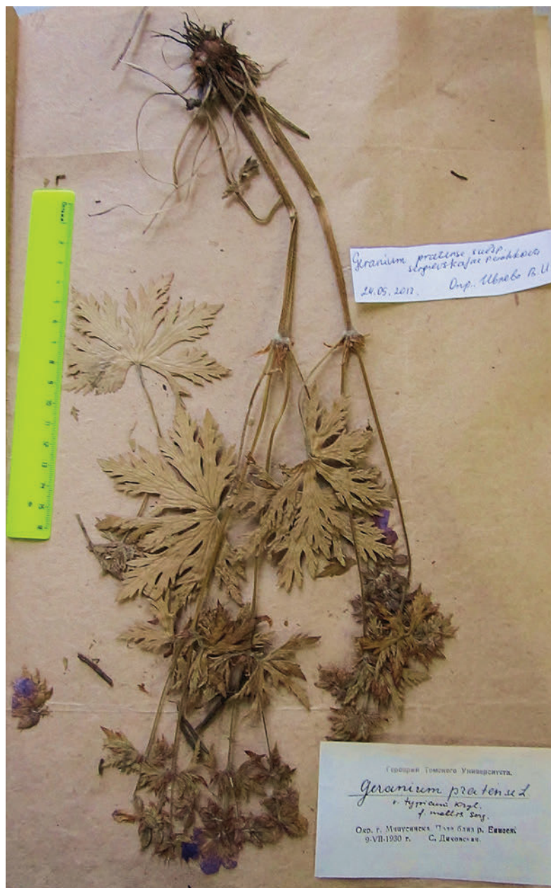
Таблица III. Лектотип Geranium pratense L. f. molle Serg. (TK).