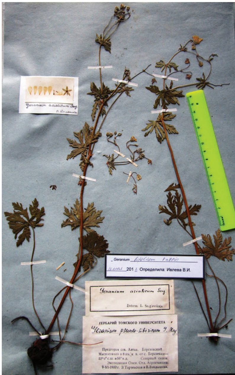
Таблица I. Лектотип Geranium asiaticum Serg. (ТК).