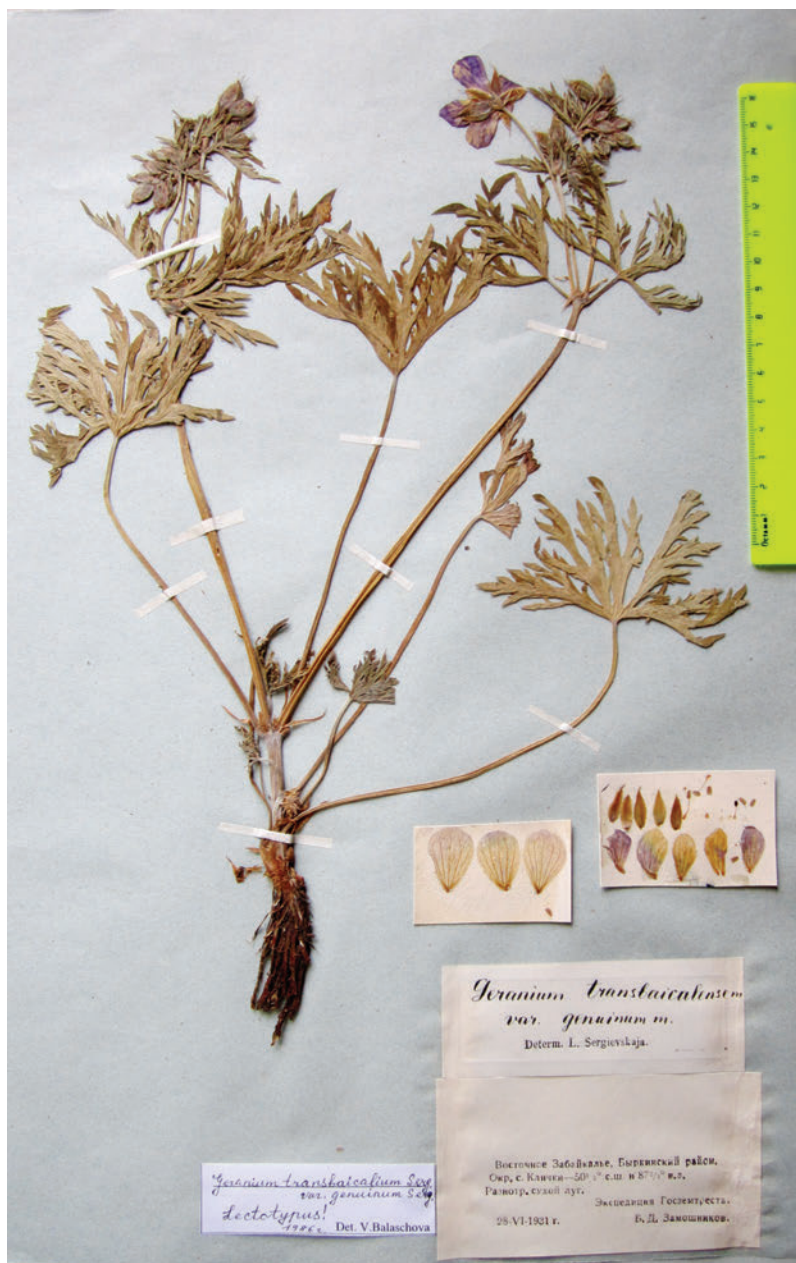
Таблица V. Лектотип Geranium transbaicalicum Serg. (TK).