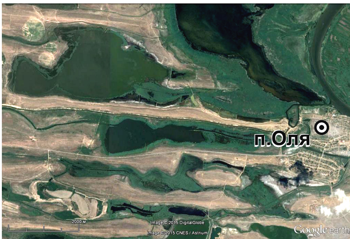
Рис. 3. Космический снимок района распространения сообществ асс. Cynancho acuti – Phragmitetum australis . Июль 2013 г. (источник: Google Earth).

Примечание. Районы обозначены на рис. 1.