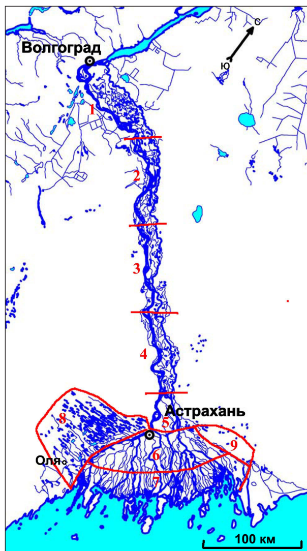
Рис. 1. Схематическая карта долины Нижней Волги.

Названия сосудистых растений приведены по списку, представленному в электронной базе «Flora Europaea», которая помещена на сайте Королевского ботанического сада Эдинбурга ( http://rbg-web2.rbge.org.uk/FE/fe.html ); при отсутствии их в этой базе указываем авторов таксонов.